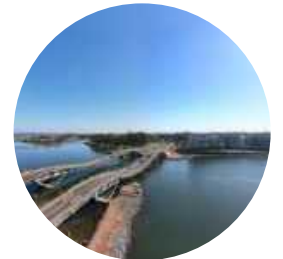
La Barra ⌚ 60 Min.