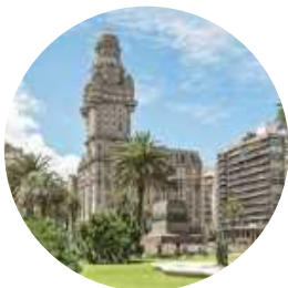
Montevideo ⌚ 120 Min.