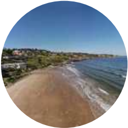
Punta Ballena ⌚ 45 Min.