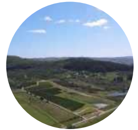
Viña Edén ⌚ 19 Min.