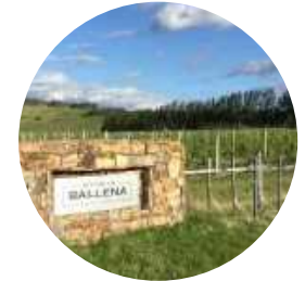
Altos de la Ballena ⌚ 30 Min.