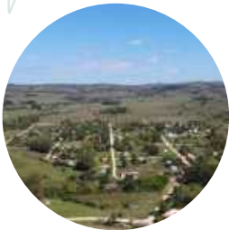
Pueblo Edén ⌚ 17 Min.

Ubicadas sobre Ruta 12 en el Km 364,300 .