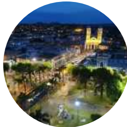
Minas ⌚ 23 Min.